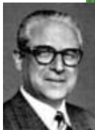
Giovanni Gronchi 1955-1962