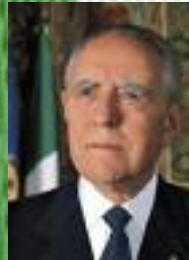
Carlo Azeglio Ciampi 1999-2006