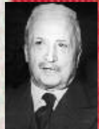
Enrico De Nicola 1948