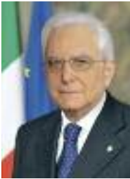
Sergio Mattarella 2015-