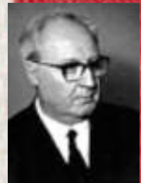
Giuseppe Saragat 1964-1971