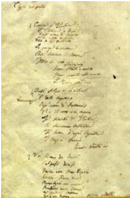
Genova, Museo del Risorgimento - Foglio volante con appunti autografi di G. Mameli

Soltanto nel 1925 si definirono, per legge, i modelli della bandiera nazionale e della bandiera di Stato. Quest'ultima (da usarsi nelle residenze dei sovrani, nelle sedi parlamentari, negli uffici e nelle rappresentanze diplomatiche) avrebbe aggiunto allo stemma la corona reale.