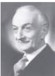
Antonio Segni 1962-1964