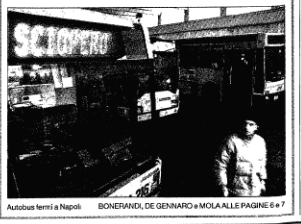
Autobus fermi a Napoli BONERANDI, DE GENARO e MOLLA ALLE PAGINE 6 e 7

Adesione altissima nella grandi città del Centro-Nord. Niente episodi di stop selvaggio Trasporti, mezza Italia bloccata "Ma da ora a Milano sarà il caos"