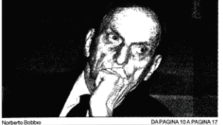
Norberto Bobbio DA PAGINA 10 A PAGINA 17

EDIZIONE Con Norberto Bobbio muore un filosofo e scorgiamo in senectute una vita, ma soprattutto una presenza politica che ha lasciato un'impronta indelebile nel pensiero e nella coscienza di un'intera nazione per la democrazia, nella costruzione di una modernità, libera dalla schiavitù ideologica del Neoveicolo.